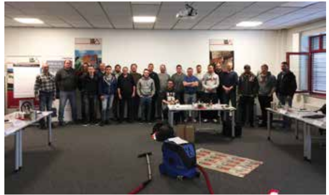
Erfolgreicher Kurs rund um Asbest

DENW sorgt dafür, dass die Mitarbeiter*innen ständig auf dem neuesten Stand der Dinge sind und wissen, wovon sie reden, wenn es um die Beratung der Kunden geht. Darüber hinaus bietet DENW jedoch kontinuierlich Fachlehrgänge an, in denen auch die Mitglieder ihre Fähigkeiten weiter entwickeln können. Darum ging es u. a. in den Kursen rund um die Arbeit mit Asbest, wie hier im Grundkurs zum Erwerb der Sachkunde nach Nr. 2.7 der TRGS 519 für Abbruch-, Sanierungs- und Instandhaltungsarbeiten von Asbestzementprodukten.