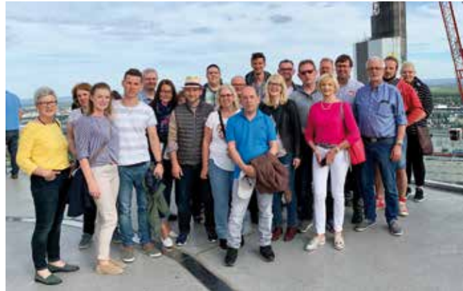
Auf Einladung von Braas und DENW: Bremerhaven-Wesermünde unterwegs.

In Sachsenhausen angekommen, wartete das erste Highlight: der Maintower! Auf rund 200 m Höhe bot sich der schwindelfreien Reisegruppe ein fantastischer Blick über die fünftgrößte Stadt Deutschlands. Wunderbar beeindruckt folgte man der Stadtführerin durch die sehenswerte Altstadt. Nach gut einer Stunde Fußmarsch war das Lorsbacher Thal erreicht: eine schöne, traditionelle Apfelwein-Wirtschaft mitten im Szeneviertel von Sachsenhausen. Stadtbummel und Besichtigung des Braas-Domizils und eine interessante Werksbesichtigung in Heusenstamm folgten am nächsten Tag.