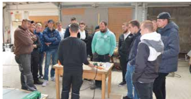
Volles Haus bei Bauder-Schulung

„You´ll never walk alone“, heißt es auch in Ostfriesland, wo die Auszubildenden der 3. Lehrjahre vor ihren anstehenden Prüfungen nicht allein gelassen werden. U. a. hat der Förderkreis Ostfriesland gemeinsam mit dem Flachdachspezialisten Bauder einen Lehrgang für die Auszubildenden organisiert. In Theorie und Praxis konnten die jungen Leute ihr Flachdachwissen verfeinern und die Produkte und ihre Eigenschaften genau kennen lernen. Abschließend zeigten sich das Lehrpersonal und die Auszubildenden begeistert.