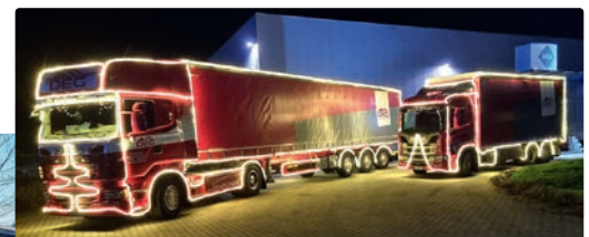
Der liebevoll und sehr aufwendig gestaltete DEG-Weihnachtstruck erregte viel Aufmerksamkeit.