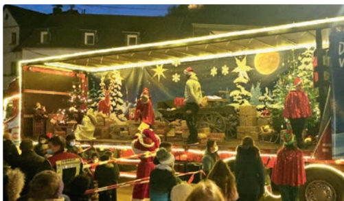
Geschenke werden an Kinder verteilt, natürlich alles im Rahmen der geltenden Corona-Maßnahmen.