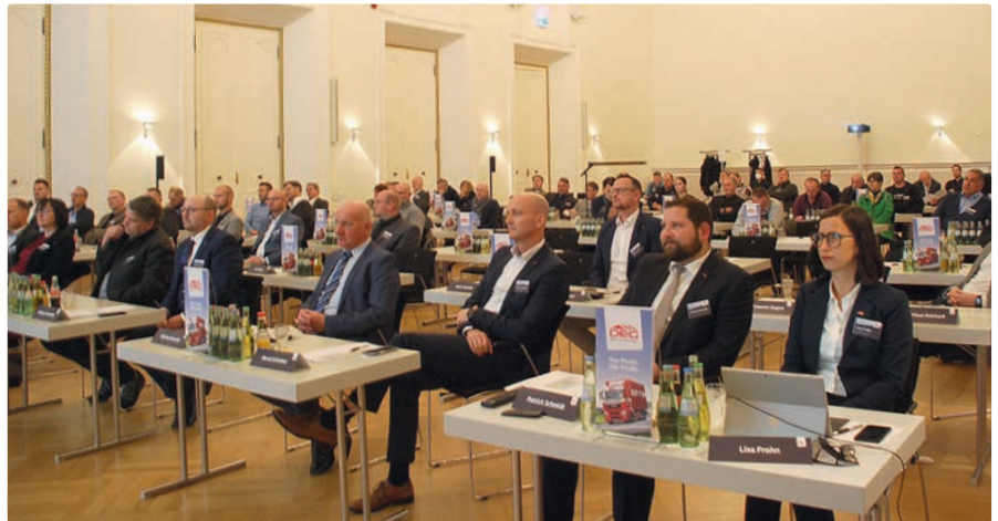
Versammlung im Festsall des Koblenzer Schlosses

Im Jahr 2020 konnten wir trotz der Corona-Krise unser sehr gutes Vorjahresergebnis von 6,6 Mio. € mit einem Rekordergebnis von