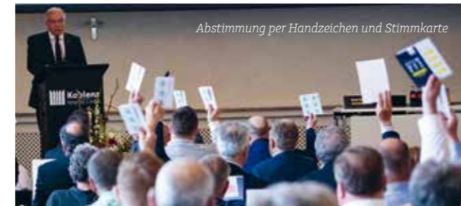
Abstimmung per Handzeichen und Stimmkarte

und lösungsorientierter Beratung und einer kundenorientierten Logistik sowie entsprechenden Serviceleistungen werden wir auch 2023 der starke Partner für das Handwerk sein.