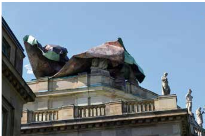
Vom Sturm abgeräumt wurde das historische Kupferdach, ein Teil davon hing am nächsten Morgen noch an den Figuren auf der Brüstung.