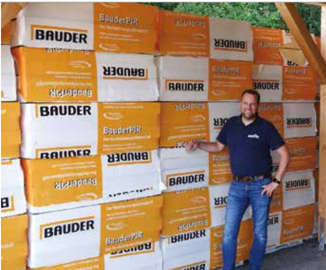
Die PIR-Dämmung für den Kitaneubau mit Sheddächern lagert seit dem Frühjahr auf dem Firmengelände.