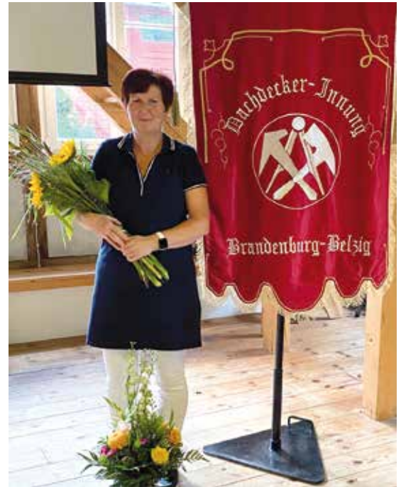
Blumen für die erste Obermeisterin in Brandenburg.

„Ich hatte schon immer Interesse am Handwerk.“