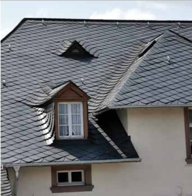
Rund 8.200 Steine, davon rund 2.400 Kehlsteine, wurden einzeln zugehauen – jeder individuell und passgenau.

spielsweise die Anschlüsse der Kehlen zu decken waren oder welches Material neben dem Schiefer verwendet werden durfte. „Die Ausführung muss einfach stimmen. Eigentlich war auch noch eine Photovoltaik-Anlage geplant. Doch da hat die Behörde leider nicht mitgespielt“, sagt Michael Ludes.