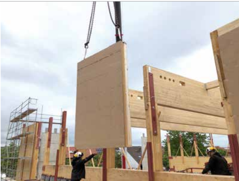
14 Zentimeter dickes Ständerwerk aus Fichte/Tanne mit einer 15 Millimeter OSB-Plattenbeplankung.