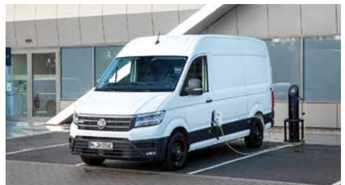
Die Umrüstung des Fuhrparks auf E-Transporter wird mit bis zu 25.000 Euro pro Fahrzeug gefördert.

Warum ist diese Unterscheidung wichtig? Die Höchstsummen der förderfähigen Ausgaben pro Fahrzeug variieren: Bei allen Fahrzeugen unter 3,5 Tonnen zahlt der Staat bei Batteriebetrieb