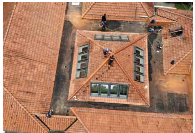
Die Sanierung der Dachfläche der großen Halle einer Grundschule ist gerade abgeschlossen.

Ein weiteres wachsendes Geschäftsfeld ist der Einbau von Dachfenstern. Sein Team baut gerade eine Lichtlösung von Velux mit drei Fenstern in einem Rahmen bei einer Kundin ein, die ihr Arbeitszimmer für das Homeoffice umbauen möchte. So etwas war früher sein Steckenpferd. „Ich habe gerne Dachfenster eingebaut.“ 21 Fenster liegen bei ihm im Lager, alle beauftragt. Sein Team macht zudem Sanierungen, Reparaturen, Sturmschäden oder Wartung, auch im Bereich Steildach.