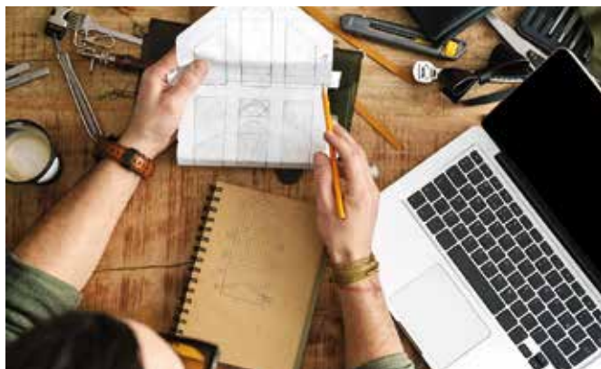
Velux bietet dem Handwerk mit neuen und weiterentwickelten digitalen Tools und Services zusätzliche Unterstützung.

Ab sofort bietet der Dachfensterhersteller eine erweiterte Handwerkersuche für Endkunden und -kundinnen auf seiner Website an. Durch Fragen zu Projekttyp und Produkten werden schon dort deren Bedürfnisse konkretisiert, bevor dazu passende Handwerksunternehmen der jeweiligen Region als Suchergebnis angezeigt werden. Die Betriebe profitieren so von