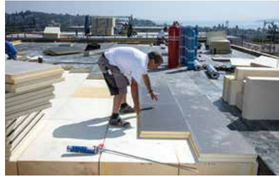
Flachdachdämmung für einen KfW 40 Plus-Standard und zudem schwerentflammbar.

Neben einem intelligenten Heizkonzept wurde besonders großer Wert auf hochwertigen Wärmeschutz (KfW 40 Plus beim Neubau und KfW 55 beim Bestandsbau) gelegt. Die Gebäude