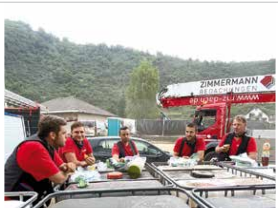
Auch Helfer brauchen mal eine Pause. Die Mitarbeiter des Teams Zimmermann sagten spontan zu, am Hilfsprojekt teilzunehmen.

Ohne den firmeneigenen Kran wären viele Hilfsarbeiten unmöglich gewesen.