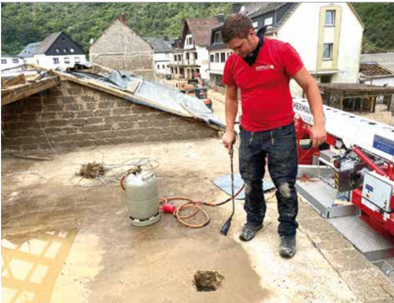
Eine der zahlreichen Aufgaben: Löcher abdichten.

Thema „Dachdecker werden“ dabei. Für ihn haben die Dachdecker mit dieser Hilfsaktion auf eindrucksvolle Weise gezeigt, was mit Mitgefühl und Taten ohne große Worte möglich ist.