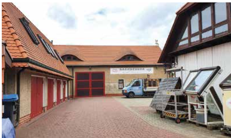
Firmengelände der Dachdeckerei Preusker in der Stadt Brandenburg.