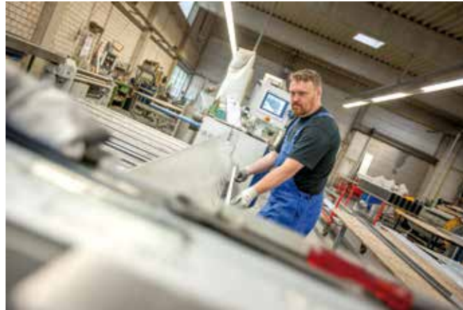
Die Standorte für Kanttechnik arbeiten mit CNC-gesteuerten Maschinen auf dem aktuellen Stand der Technik.