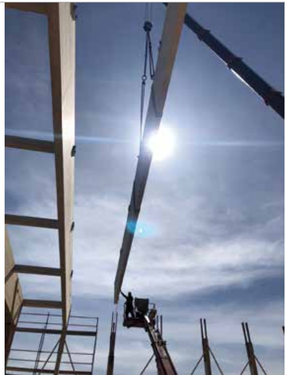
Die Längsbinder sind aus einer 30 Zentimeter dicken Leimholzkonstruktion.

Thomas Griesser und sein 27-köpfiges G+S-Team sind nicht nur Perfektionisten – sie lieben es auch, solche Projekte in Holzbauweise bis zur Dachoberkante komplett durchzuziehen. Beim Tragwerk fiel auf G+S-Emp-