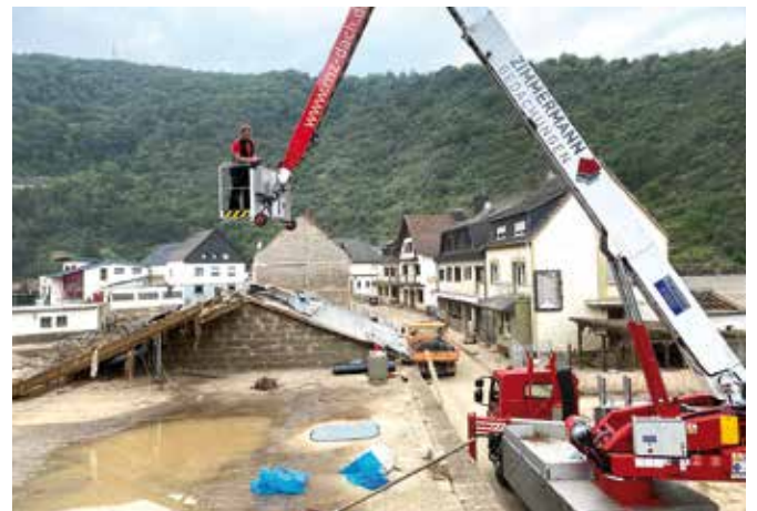
Ein Notdach installieren mithilfe des eigenen Firmenkrans.