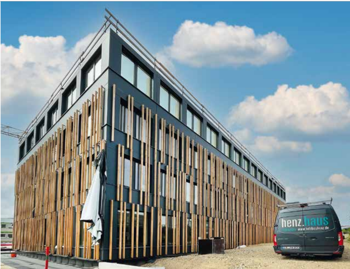
Die Gebäudehülle wurde in der Werkstatt komplett vormontiert und die einzelnen Elemente auf der Baustelle zusammengefügt. Die Fassade aus dunklen Tresaplatten und vorgehängten Holzlisenen wirkt edel und natürlich.