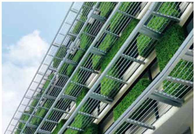
Auch Fassadenbegrünung kann einen Betrag zum Klimaschutz leisten.