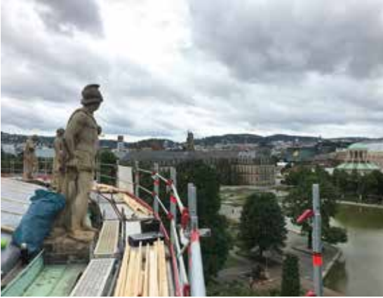
Schnappschuss vom Notdach auf dem Opernhaus am Morgen nach dem Sturm.