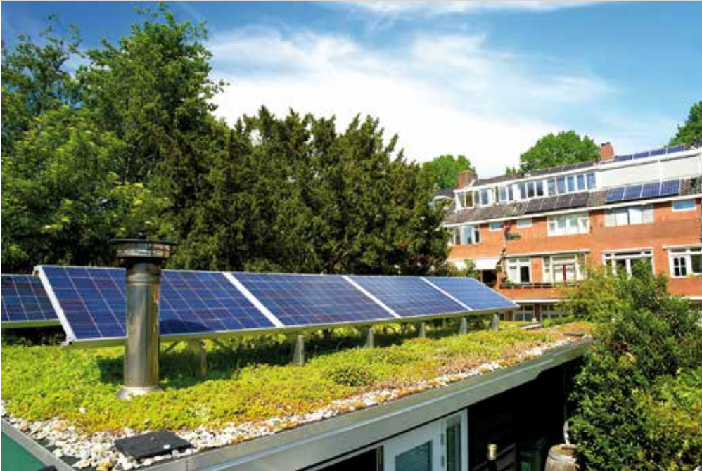
Die Kombination mit einem Gründach bringt durch Dachkühlung einen höheren Ertrag der PV-Anlage.