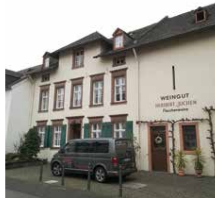
Das Originaldach des Weinguts Heribert Jochem von 1905 war in die Jahre gekommen.

„Der Kunde ist begeistert von seinem neuen Dach und meint, das sei ein Meisterwerk geworden. So ein Lob von einem zufriedenen Kunden bedeutet uns viel.“ Und dafür stehen er und seine Mitarbeiter auch gerne mal bei „Mistwetter“ auf dem Dach. „Wir haben im April mit den Arbeiten angefangen – und der machte seinem Namen alle Ehre. Wir haben