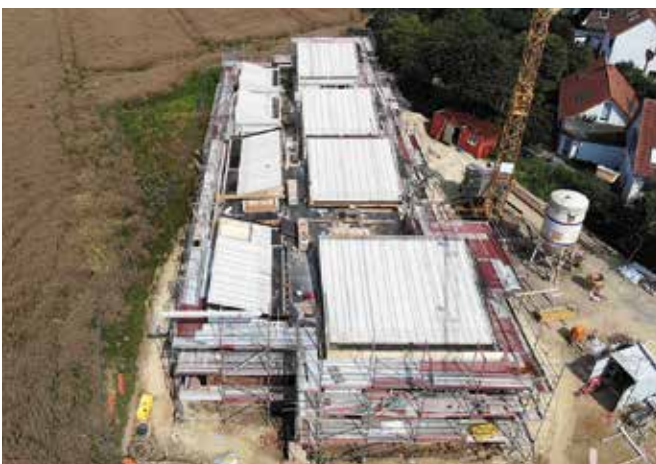
Ein Kitaneubau mit Sheddächern ist das nächste Projekt der Dachdeckerei Brummerhop.

Auch für Privatkunden macht Brummerhop viel Flachdach. Die Aufträge kommen über Kontakte, Empfehlungen oder auch Architekten. Warum ist das so? „Weil wir gut sind“, antwortet Wietis mit Überzeugung und einem Lachen. „Wir sind zuverlässig, gerade bei den Terminen. Geht nicht, gibt’s nicht bei uns. Und wenn es regnet, holen wir die Zeit danach wieder rein.“