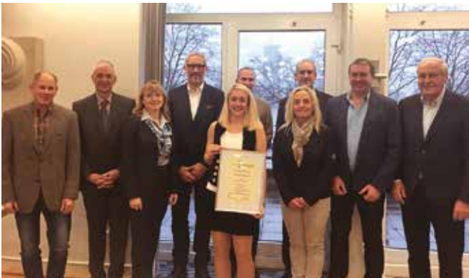
Ehrenurkunde für die Auszeichnung „Lehrling des Jahres“ der HWK Köln.