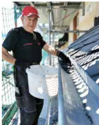
Schieferarbeit in Vollendung auf dem Dach des denkmalgeschützten Weinguts.

So wurden binnen vier Wochen rund 200 Quadratmeter Dachfläche erneuert: Die alten Schiefersteine wurden abgetragen und entsorgt, der Dachstuhl, wo nötig, ausbeessert. „Wir haben eine Unterdeckbahn eingezogen und anschließend das Dach