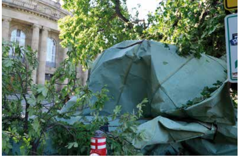
Ein Teil des Kupferdaches landete zwischen Bäumen und Sträuchern vor dem Opernhaus.