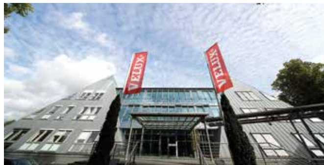
Dachfensterhersteller Velux baut die Serviceleistungen für Handwerksbetriebe mit neuen digitalen Angeboten weiter aus.

bereits gefilterten, vorqualifizierten Anfragen und von dem Zusatzgeschäft durch diese Anfragen über die Velux Website: Ein Unternehmen, das sich ausschließlich auf das Schrägdach konzentriert, erhält keine Anfragen für Flachdachprojekte. Unternehmen mit dem Fokus auf Sanierung bekommen keine Kunden, die einen Neubau planen. Mit Dachfensterreparatur- und Garantiefällen werden die Handwerksbetriebe gar nicht belastet; diese werden direkt an das Velux Service-Team weitergeleitet.