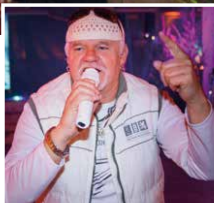
■ Sorge für gute Stimmung: Der Auftritt eines DJ Ötzi-Doubles.

Zwei Eisstockbahnen und der Auftritt eines verblüffend ähnlichen DJ Ötzi-Doubles machten das winterliche Alm-Feeling nahezu perfekt.