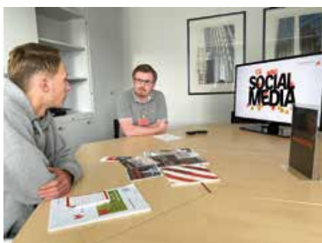
Speed-Dating: Vorstellung Marketing mit einer animierten Präsentation

Am zweiten Tag bekamen die Azubis aus erster Hand einen Überblick über die Struktur, Philosophie und Strategie der Genossenschaft und welche Meilensteine sie in ihrer Ausbildung erwarten. Mit einem zweiten Vortrag wurden sie in Bezug auf Sicherheit im Unternehmen sensibilisiert.